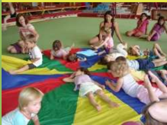
Section non compétitive