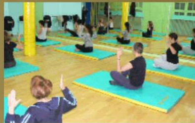
FORME ET LOISIR