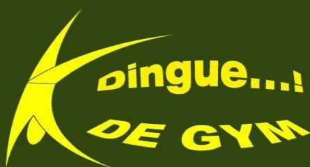
Section non compétitive

ajouter 16€ lors de votre première inscription