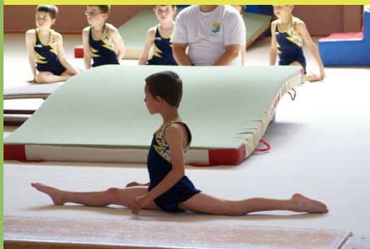
Section non compétitive